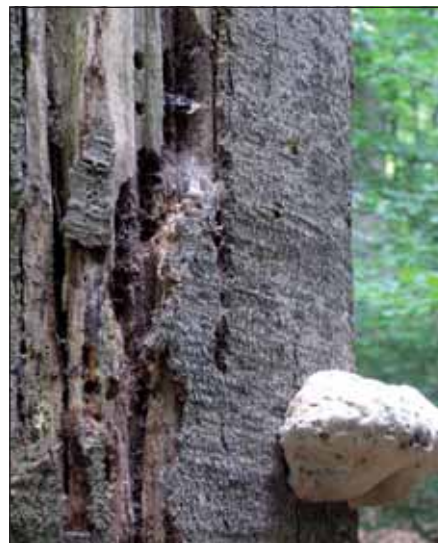
Vom Kulturbiotop bis zum striktem Nichtstun reichen die Aufgaben der Großschutzgebiete. In Nationalparks heißt das Motto: „Natur Natur sein lassen“

dienen der Erhaltung der Leistungsfähigkeit des Naturhaushaltes mit weniger harten rechtlichen Beschränkungen in der Nutzung.