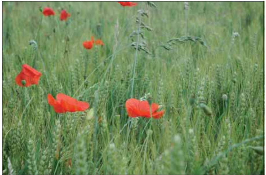
In Naturparks und Biosphärenreservaten ist eine nachhaltige Forst- und Landwirtschaft erlaubt.

In der sich daran anschließenden Entwicklungszone steht die nachhaltige Regionalentwicklung im Vordergrund. Die Biosphärenreservate sind Teil des Programms „Mensch und Biosphäre“, das die Organisation der Vereinten Nationen für Erziehung, Wissenschaft und Kultur UNESCO* 1970 ins Leben rief. Ziel ist es, durch beispielhafte Maßnahmen ein verträgliches und dauerhaftes Miteinander von Mensch und Natur zu erproben. Das heißt, es werden Wechselwirkungen zwischen wirtschaftlicher Nutzung und der Entwicklung von natürlichen Lebens-