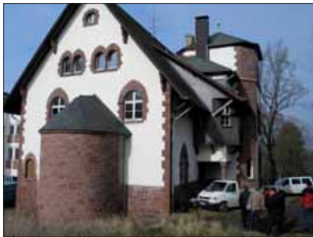
Haus der Familie in Nideggen.

Die Stadt Nideggen eröffnet im Frühjahr das fünfte Nationalpark-Tor im ehemaligen „Haus der Familie“ des Bistums Aachen. Wie in jedem Nationalpark-Tor, stellt das Umweltministerium NRW über die Nationalparkverwaltung eine Ausstellung bereit: Diese soll sich mit dem „Wert der Natur“ beschäftigen und vor allem Jugendliche als Zielgruppe ansprechen. Passend zu den sonstigen Einrichtungen des mehrstöckigen Hauses, denn in die oberen