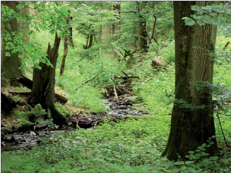
In Nationalparks ist die wirtschaftliche Nutzung eingestellt.

Nationalparks sind nahezu ursprüngliche Gebiete von nationaler Bedeutung. Das heißt, sie repräsentieren ein charakteristisches Ökosystem, wie im Fall der Eifel atlantisch geprägte Buchenmischwälder auf nährstoffarmen Böden. Der Bayerische Wald dagegen schützt Bergmischwälder. Und die Nordsee-Nationalparke ihre Wattenmeerökosysteme und Küstenbereiche. (§ 24 BNatSchG) Sie haben die Aufgabe weitgehend ursprüngliche Landschaftsteile als nationales Naturerbe für kommende Generationen zu erhalten. Doch nur wenige Landschaften sind noch ursprünglich zu nennen. Daher muss auf Landschaften zurückgegriffen werden, die sich in naturnahe Gebiete zurückentwickeln lassen. In diesem Fall spricht man von Entwicklungs- oder Ziel-Nationalparks, zu denen auch der Nationalpark Eifel zählt.