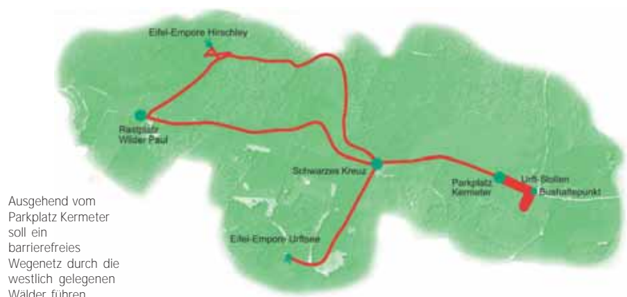
Ausgehend vom Parkplatz Kermeter soll ein barrierefreies Wegenetz durch die westlich gelegenen Wälder führen.

Erlebnisraum eine Fokussierung der Besucher auf das klar markierte Wegenetz unterstützen und damit zu einer Beruhigung sensibler Lebensräume beitragen. Um die notwendigen Eingriffe zu minimieren, sollen als nächster Schritt die Auswirkungen der geplanten Maßnahmen auf die Tier- und Pflanzenarten bewertet werden. Dazu ist zeitnah ein Termin mit den anerkannten Naturschutzverbänden und Genehmigungsbehörden geplant. Unterstützt wird die Entwicklung barrierefreier Angebote zudem von der Blindenschule Düren, dem Gehörlosenheim Euskirchen, der Anna-Freud-Schule in Köln, der Lebenshilfe Euskirchen und der Nationalen Koordinationsstelle Tourismus für Alle (NatKo e.V.). Entstanden sind so in den vergangenen Jahren bereits barrierefreie Ausstellungen, Führungen, Umweltbildungsprogramme, Internetseiten und ein Geräuschememory. „Wenn die Region bei der Entwicklung barrierefreier Angebote weiterhin so intensiv und eng zusammenarbeitet, wird die Eifel in wenigen Jahren eine der Top-Naturerlebnisregionen für Menschen mit und ohne Behinderungen sein“, blickt Nationalparkleiter Henning Walter zuversichtlich in die Zukunft.