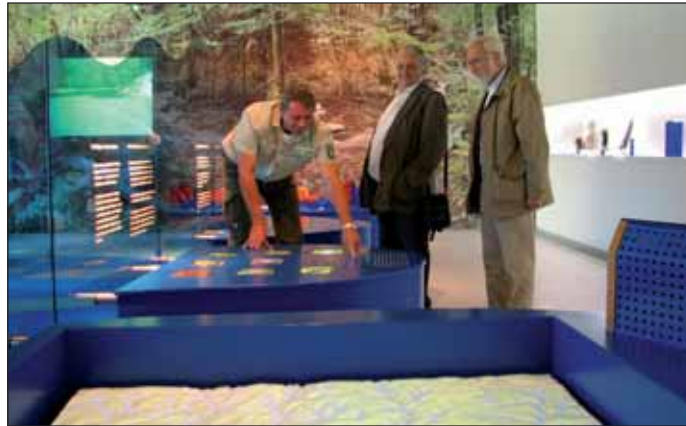
Internationale Jurymitglieder besichtigen die Nationalpark-Tore, hier in Rurberg.

Laut Ohm nutzten rund 70% der Befragten die Ausstellungen. Die meisten von ihnen konnten nach ihrem Besuch Zweck und Aufgaben eines Nationalparks richtig darstellen. Erfreulich ist, dass sich detailliertes Wissen, wie beispielsweise die Kenntnis bestimmter schützenswerter Arten erhöhte, je länger Themenausstellung und Kurzfilm genutzt wurde. Ohm: „Dies ist ein deutlicher Hinweis darauf, dass die Informationsvermittlung durch Film und Themenausstellungen funktioniert.“ Die Besucherzufriedenheit mit Angebot und Service in den Nationalpark-Toren „kann als durchgehend enorm hoch bezeichnet werden“, so Ohm. Inhalt und Präsentation der Themenausstellungen wurden von über