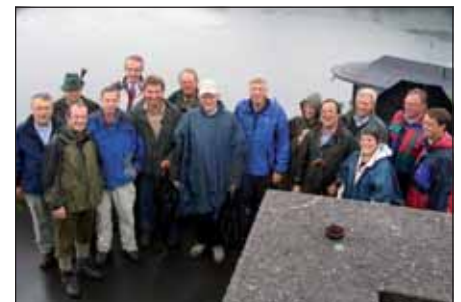
Verschnaudpause an der Urftstaumauer.

Trotz Regen genossen die Kabinettsmitglieder im August ihre Wanderung durch den Kermeter. Ministerpräsident Jürgen Rüttgers und seine Minister und Ministerinnen zeigten sich von der „Wildnis aus zweiter Hand“ beeindruckt und waren erfreut darüber, dass sich das Großschutzgebiet als Besuchermagnet und Impulsgeber für die Regionalentwicklung etabliert hat. NRW-Umweltminister Eckhard Uhlenberg hat die Exkursion so gut gefallen, dass er im Oktober zum Wandern wiederkam und für zwei Tage Ruhe und Natur auf dem Wildnis-Trail genoss.