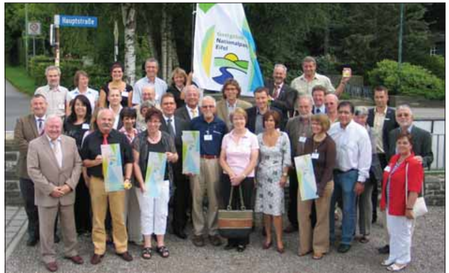
Weitere 18 Gastronomie- und Übernachtungsbetriebe ließen sich im Juli zu Nationalpark-Gastgebern zertifizieren. Damit haben bislang 46 Betriebe an der Qualifizierung teilgenommen.

Segmenten, beispielsweise durch beauftragte Forschungsarbeiten, das Durchführen von Naturschutzmaßnahmen, Förderprogramme, den Bau von Informationshäusern, die Einrichtung von Ausstellungen oder die Schaffung neuer ÖPNV-Angebote, wurden bei den Berechnungen nicht berücksichtigt und können somit zu oben genannten Werten noch hinzugefügt werden. Die Studie gibt auch Handlungsempfehlungen. Der Anteil an Tagesbesuchern ist mit 76 Prozent höher als in anderen Nationalparkregionen. Nach Professor Job liegt das an der besonderen Lage des Nationalparks Eifel umgeben von Ballungsräumen im bevölkerungsreichsten Bundesland Deutschlands. Ökonomisch interessanter sind jedoch Übernachtungsgäste. Diese geben durchschnittlich 46,88 Euro am Tag,