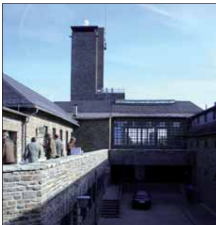
Das künftige Nationalpark-Informationszentrum.

„Natur Natur sein lassen“ - die Philosophie aller Nationalparke sollen Besucher in der Ausstellung des künftigen Nationalparkzentrums auf Vogelsang sinnlich erfahren können. In der Ausstellung, die zum Staunen und Begreifen anregen soll, wird das Thema „Wildnis“ eine besondere Rolle spielen. Dabei wird die faszinierende Vielfalt der Lebensformen im Nationalpark Eifel, aber auch aus anderen Teilen der Welt vorgestellt. Im Sinne der „Bildung für nachhaltige Entwicklung“, ein Zehnjahres-Programm der Vereinten Nationen, sollen weltweit und integrierend auch soziale Aspekte, das heißt, der Umgang der Menschen miteinander und mit der Natur, beachtet werden. Damit sich alle Gäste