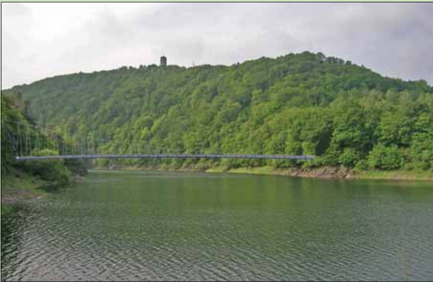
Unauffällig passt sich die geplante Brücke dem Landschaftsbild an.