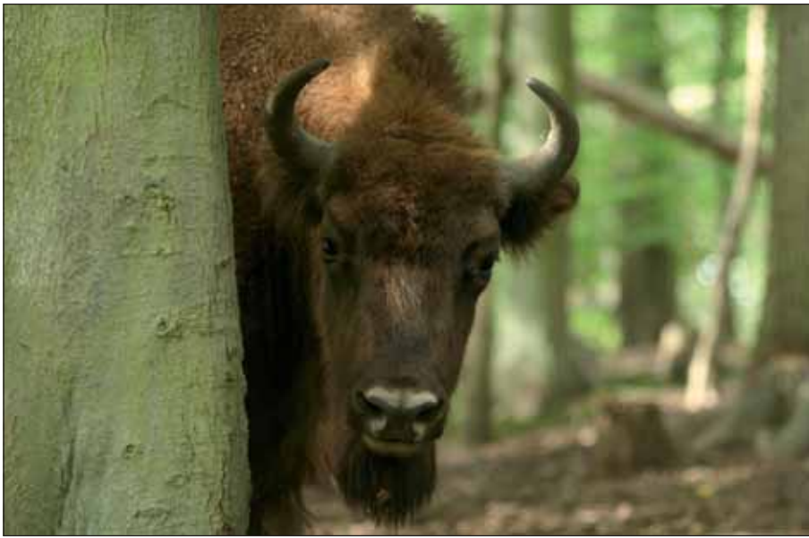
Wisente zählen zu den Vorfahren unseres Hausrindes.

Hart stampft der Bulle seine Hufe in den Boden, wütend schwenkt er seinen Kopf zur Seite, schnaubt. Der riesige Körper, der bis zu zwei Metern hoch und bis zu 1.000 Kilo schwer sein kann, ist angespannt. Nicht weniger beeindruckend zeigen sich die zotteligen Wisentkühe. Die Herde bewegt sich zögerlich aus dem Wald in das offene Grasland in Richtung der Beobachtungsplattform. Solche oder ähnliche Szenen können Nationalparkgäste vielleicht auch im geplanten Wisentgehege bei Mariawald zukünftig beobachten. Die Nationalparkverwaltung in Gemünd lässt derzeit verschiedene Varianten eines Geheges prüfen, das für zirka 15 Exemplare des größten Wildrindes Europas ein artgerechtes Leben sichern soll.