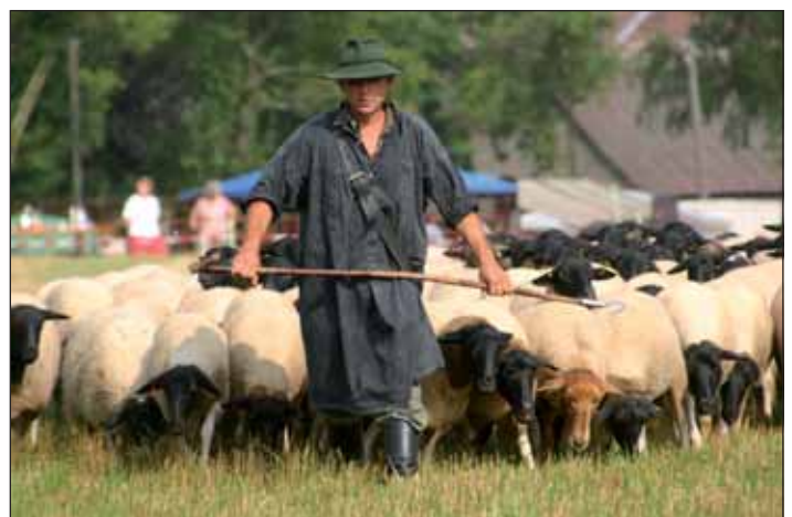
Das Biosphärenreservat Rhön ist bekannt für seine gewachsene Kulturlandschaft und die erfolgreiche Vermarktung des Rhönschafes.

Naturparke orientieren sich vorrangig am Leitbild einer Kulturlandschaft, die nur mit den und für die im Gebiet lebenden Menschen bewahrt und entwickelt werden kann. Diese Aufgabe erfüllt auch der Deutsch-Belgische Naturpark Hohes Venn - Eifel. Er ist einer von 14 Naturparks in NRW und liegt mit seinen 2.700 Quadratkilometern länderübergreifend in NRW, Rheinland-Pfalz und Ostbelgien. Sein Schwerpunkt liegt in der Entwicklung von Projekten zum Natur- und Landschaftserlebnis, zur nachhaltigen Regionalentwicklung und zum Naturschutz. Dabei arbeitet der Naturpark auch eng mit der Nationalparkverwaltung zusammen.