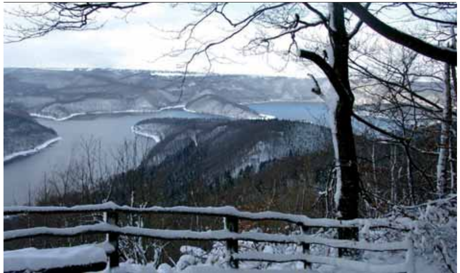
Der Aussichtspunkt Hirschley soll barrierefrei - für Menschen mit und ohne Behinderungen - erlebbar werden.

erfahrenen Partner den Naturpark Nord-eifel gefunden. Gemeinsam wurde für einige der geplanten Maßnahmen eine finanzielle Förderung beantragt, ohne die eine Umsetzung nicht möglich wäre. Ein weiterer Partner ist der Kreis Euskirchen, der sich für eine barrierefreie Gestaltung der Bushaltstellen im Umfeld einsetzt. Erste Entwurfsplanungen wurden bereits durch das Landschaftsarchitekturbüro Hoff (Essen) in Zusammenarbeit mit dem J.O.B.-Medienbüro (Berlin) erarbeitet. Diese sind so konzipiert, dass Eingriffe in die Natur minimiert werden. Die Maßnahmen sollen, wo immer möglich, selbst einen Beitrag zur Verbesserung der naturschutzfachlichen Situation leisten. Beispielsweise soll im Rahmen des Projektes ein etwa zwei Kilometer langer asphaltierter Weg zurückgebaut und mit einer ökologisch weniger problematischen Schotterdecke versehen werden. Darüber hinaus trägt die Neugestaltung und Erweiterung des Parkplatzes dazu bei, dass im Gegenzug sechs Parkplätze im Kermeter mit einer Gesamtfläche von rund 8.700 Quadratmeter aufgegeben bzw. zurückgebaut werden können. Zudem soll der Natur-