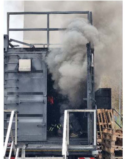
von Christian Heinrichs

Die Teilnahme der Feuerwehr Schleiden unterstrich die hohe Bedeutung kontinuierlicher Fortbildung für die Einsatzbereitschaft vor Ort. Die jüngste Fortbildung stellte zudem eine optimale Ergänzung zum jüngsten Atemschutzseminar unserer Stadtfeuerwehr dar.