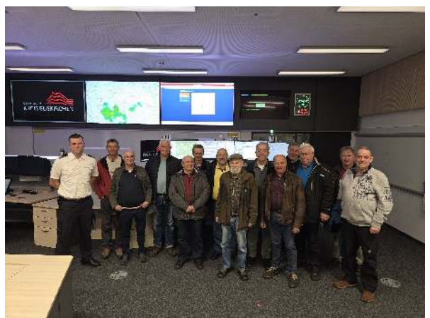
von Simon Walber