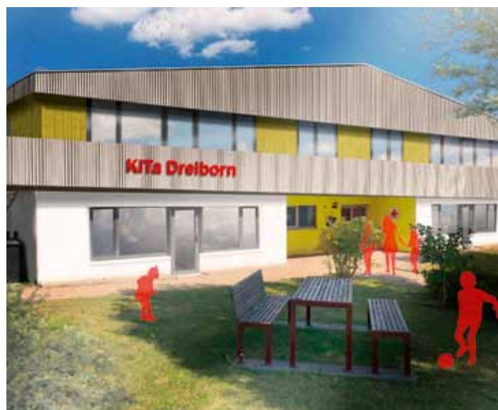
Ansicht der Erweiterungsmaßnahme (© Architekturbüro Holdenried)

Die Nachfrage nach Kinderbetreuungsplätzen für unter dreijährige Kinder steigt seit Jahren kontinuierlich an. Da zu Beginn des Kindergartenjahres 2019/2020 seitens des Kreises Euskirchen die Kita-Beiträge erheblich gesenkt wurden, ist davon auszugehen, dass der Bedarf an zusätzlichen U3-Plätzen in den Kindertageseinrichtungen noch weiter zunehmen wird.