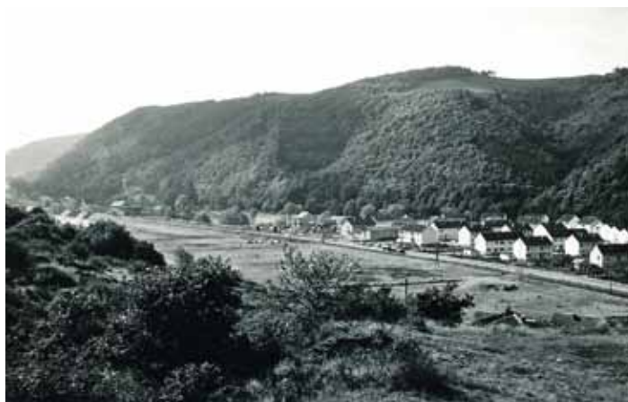
Im Westen angesiedelt: Der Nierfelder Auel 1963.