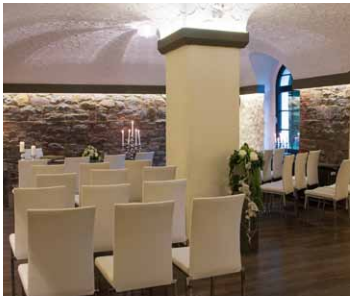
Nutzen Sie doch den Pauluskeller für eine Ambiente-Trauung

Das klassische Trauzimmer befindet sich in der zweiten Etage im Haus A des Rathauses und verfügt über 25 Sitzplätze. Für die Nutzung während der Ehe-