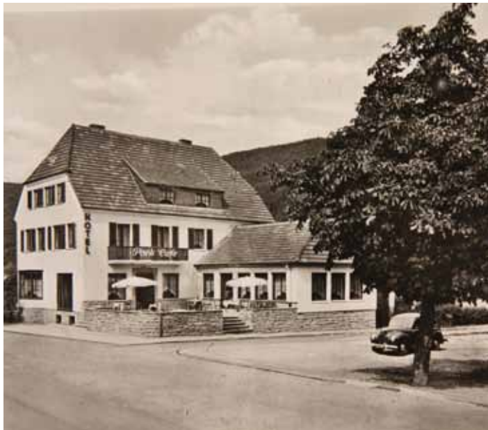
Das wiederaufgebaute Hotel und Café Lünebach.

In der UrfseeestraÙe 8, Ecke KurparkstraÙe in Gemünd, hinter dem heutigen Finanzamt, steht ein Gebäude, welches eine wechselvolle Geschichte hinter sich