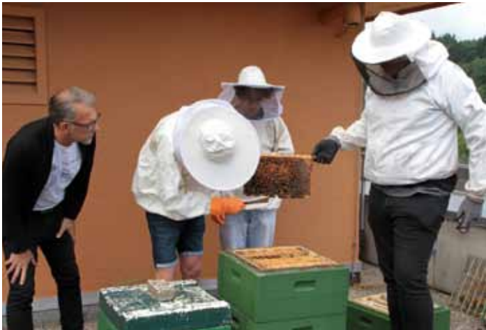
Behutsam wird der Bienenstock geöffnet, um die mit Honig gefüllten Wabenrahmen zu entnehmen.

die Schüler an der Bienen-AG teilnehmen. „Das, was wir hier machen, ist auch sehr nachhaltig“, berichtet einer der Schüler, „denn durch unsere Arbeit bleiben die Bienen erhalten.“ Im Zeitalter des Insektensterbens also eine mehr als gute Sache.