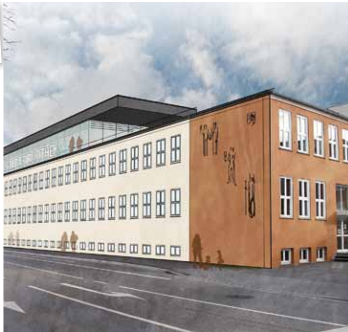
Ansicht Blumenthaler Straße

Bürgermeister Pfnings dazu: „Die Zusage der Förderung seitens des Ministeriums ist ein richtiges und wichtiges Zeichen, für das ich der Ministerin, ihren beteiligten Mitarbeitern und unseren Landtagsabgeordneten sehr dankbar bin. Wir