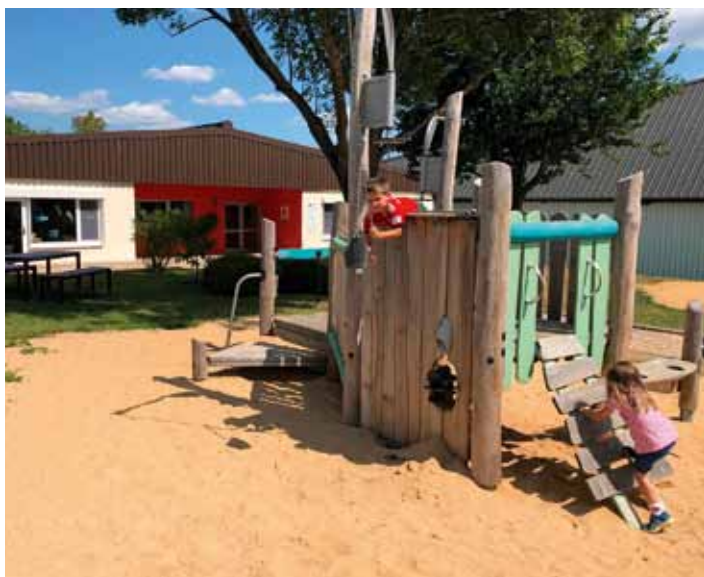
Der Kindergarten Dreiborn wird ab Herbst 2019 ausgebaut