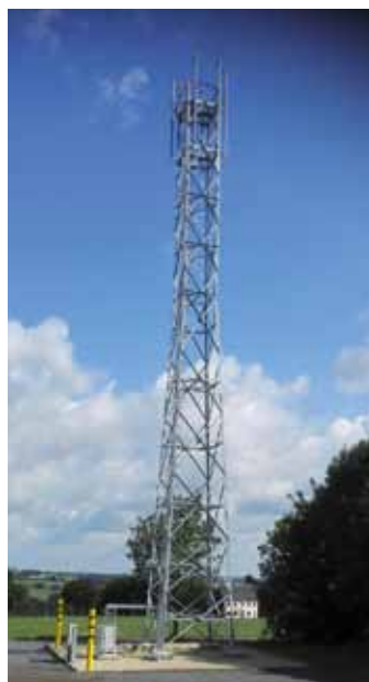
Der Mobilfunkmast am Sportplatz Schönesseiffen

Die Stadt Schleiden macht sich weiter fit für die Zukunft: Auf Initiative der Stadtverwaltung baut die Telekom Technik GmbH ihr Mobilfunknetz im Bereich Harperscheid/Schönesseiffen sowie Dreiborn/Berescheid an nachstehenden Standorten aus: