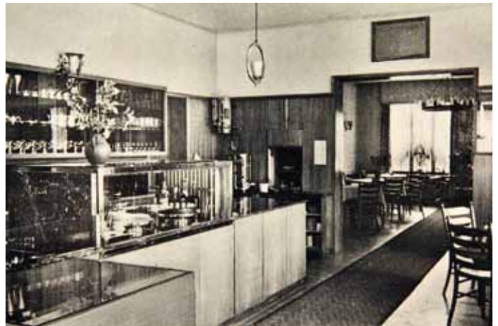
Gastraum des Hotels Lünebach.

Da kein Nachfolger für die Führung des Hotels zu finden war, schloss das Hotel im Jahre 1956. In der Folgezeit wechselte das ehemalige Hotel wiederholt seine Bestimmung. Das DRK richtete ein Müttererholungsheim ein, in den achtziger Jahren kam es an den Konditormeister Engel, der dann dort ein Café errichtete. Im Jahre 1995 wurde das Hotel Lünebach umgebaut und im Erdgeschoss unter anderem eine Seniorentagespflegestätte für bis zu 12 Personen eingerichtet. Heute sind im ganzen Haus Wohnungen eingerichtet.