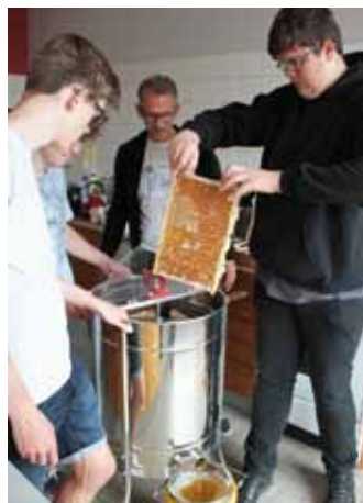
Die ersten Rahmen mit den Honigwaben werden in die Schleuder gefüllt.

Das Bienenvolk residiert auf dem Dach der Schule, quasi vis-à-vis zur Schlosskirche und zum alten Schloss, wofür die Bienen aber zurzeit keinen Blick haben, da sie von Sonnenaufgang bis Sonnenuntergang unermüdlich bei