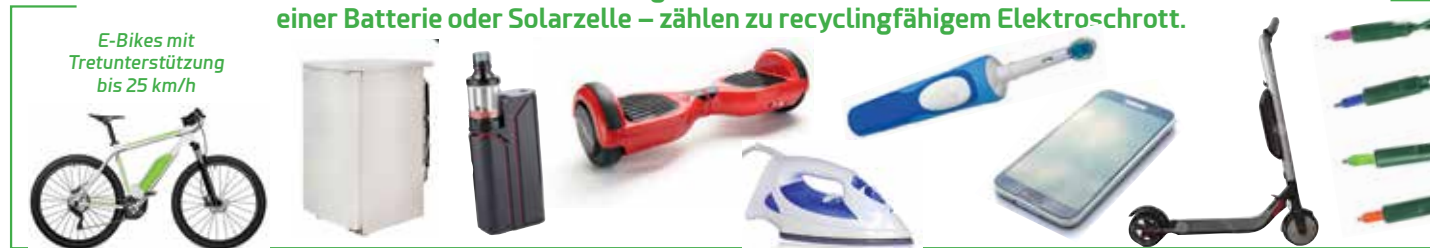
E-Bikes mit Tretunterstützung bis 25 km/h

Fast alle Geräte, die Strom benötigen – ob aus der Steckdose, dem Telefonkabel, einer Batterie oder Solarzelle – zählen zu recyclingfähigem Elektroschrott.