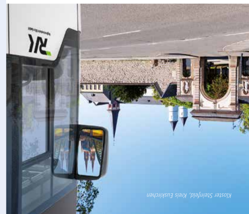
Kloster Steinfeld, Kreis Euskirchen