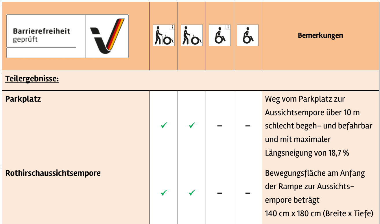
Tabelle 1: Überblick über das Prüfergebnis