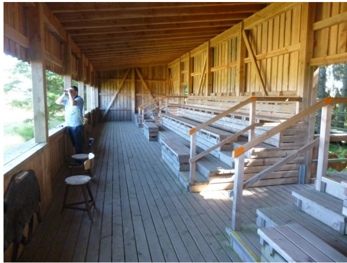
Rothirschaussichtsempore im Nationalpark Eifel